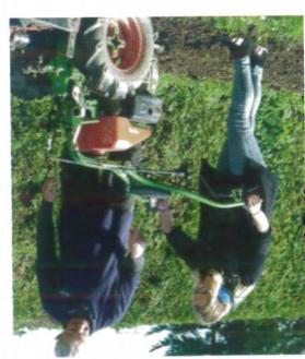
Echte Praxis statt Theorie: Schüler-Power Teilnehmer in der Baumschule.